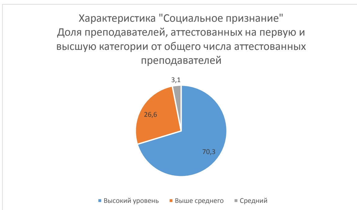
Рис. 2 Характеристика «Социальное признание»

По данным исследования особенно важно для колледжа, что на такие уровни как ниже среднего и низкий не был оценен ни один преподаватель.